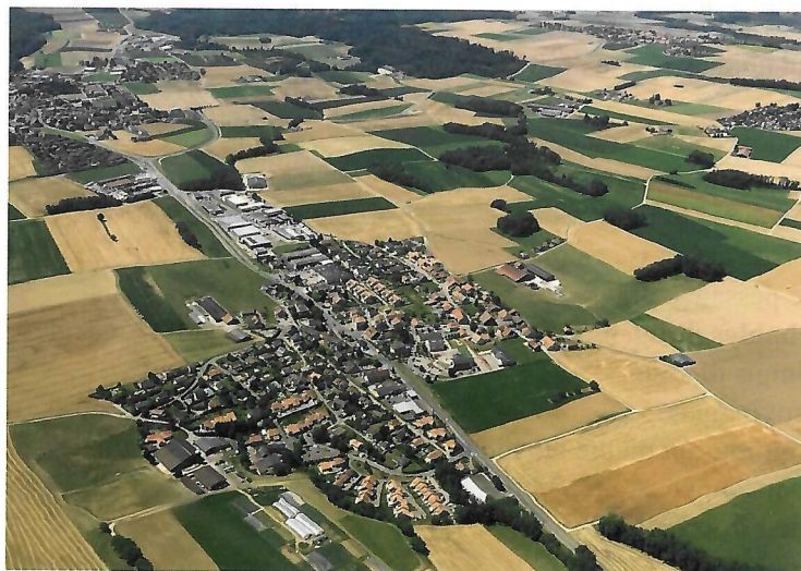
Étagnières (VD). vue aérienne.

10. An ât cment qu'an ât. Les aimis, lai voidjou, Lai fonjû, lai frédgeure, Lo dûmoinne â tchaîlat. An ât po l'aipaîjment, Poéchqu'an ont des prînychipes, An ât des tot bons zidyés. Cainton d'Vâd, réchpèt !