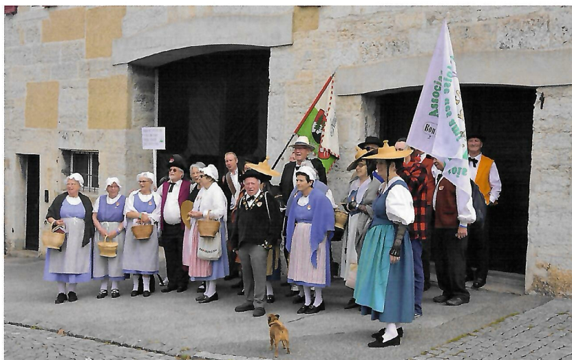
Association vaudoise des patoisants, Porrentruy.

10. An ât cment an ât Les aimis, lai voidgeou, Lai fonjûe, lai reûtie, Le duemoine é tchailat An ât po lai paix Poéchque qu'an é des prîncipes An ât des tos bons bouébes. Caiton de Vaud, réchpèt !