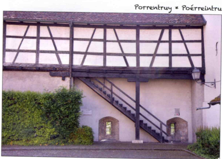
Les remparts. Photo Bretz, 2022.