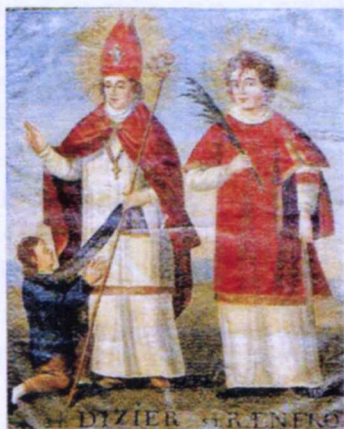
L'évêque Désidérius et son éde, Reinfroid

Tot en aivâ di câre de Béfoue, è quéques péssaies d'lai Suisse, voili lou v'laidge de Saint-Dizier l'évêque.