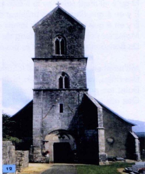
Lou môtie de Saint-Dizier l'Evêque qu'â le pus véye d'lai contrée