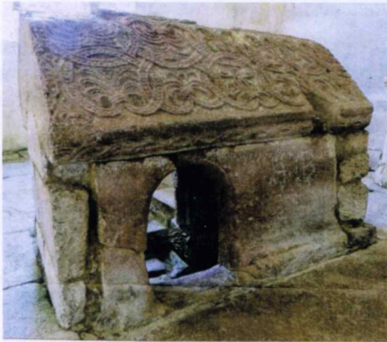
Lai piere dés fôs, dôs laiquêlle en f'sait péssaie lés malaites. Elle se trove touedge dains lou môtie di v'laidge

Aidont an è botaie chu pie dés pélrinaidges en seuv'ni de Saint Dizier ét âchi enne écâméchainte chérémounie po épreuvaie d'voiri cés poûeres dgens qu'sont déraindgis d'lai tête, lés fôs. Et çoli n'â p'enne raiconte è dremi drassie !