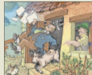
Situations piquantes croquées par Nicolas Sjöstedt.

duire 33 contes et légendes en version moderne, tout en prenant bien soin de conserver les mots et les expressions les plus croustillantes en V.O.